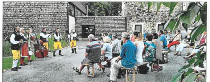
Im Innenhof der Tourist-Info sorgte die Dudelsack-Kapelle „Dudaci“ für beste Unterhaltung.