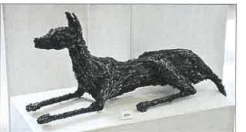
„Anubis“, Stahl, Jochen Michel.