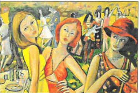
„Gartenparty“, Öl auf Leinwand, Anna Halasová.