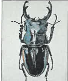
„Hirschkäfer“, Öl auf Leinwand, Manfred von Glehn.