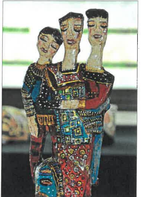
„Patchworkfamilie“, Keramik, Linde Kroher.