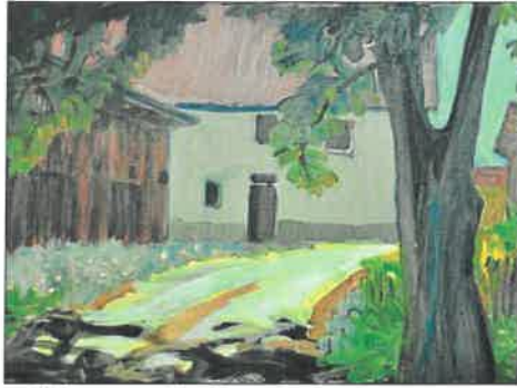
„Hof in Oberfrauenau“, Acryl auf Leinwand, Ilse Brantl-Bader.

Die „Zwiesler Buntspecht“ ist bis 26. August täglich geöffnet von 11 bis 17 Uhr. Geöffnet ist auch während der heutigen Glasnacht, bei der der Wald-Verein ab 18 Uhr zur Kunstnacht mit Musik und Bewirtung einlädt.